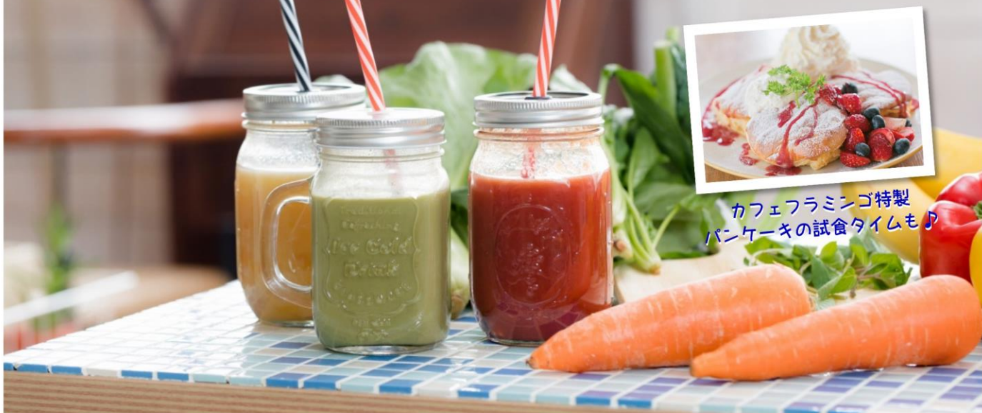
カフェフラミンゴ特製 パンケーキの試食タイムも♪

人気カフェ「カフェフラミンゴ」でオリジナルスムージー作り を体験しながらのカップリングパーティーを開催します