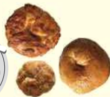
自家製ベーグル スコーン